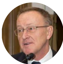
Крылов Владимир Викторович акад. РАМН, д.м.н., профессор, главный нейрохирург Департамента здравоохранения г. Москвы, главный внештатный нейрохирург МЗ РФ, Москва