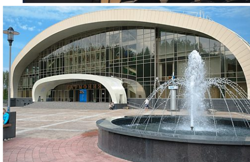
Легкоатлетический манеж «Гармония»

Томск, ул. Высоцкого, 7, стр. 6 (Автобусная остановка с/к «Кедр»)